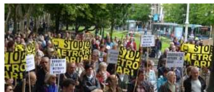
METRO IGAROBIDEAREN AURKAKO JARDUERA INFORMATIBOAK EGITEN ARI DIRA DBUSEN