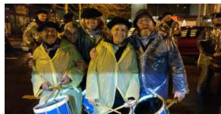
IBAETAKO JAIK, IRUDITAN