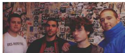
ARKAIKO TALDE DONOSTIARRAK DISKO BERRIKO AURRERAPEN KANTUA AURKEZTU DU