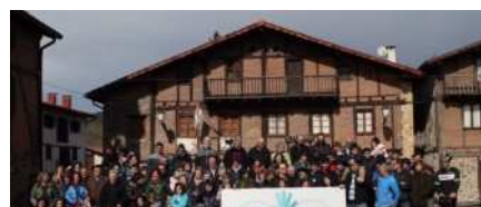
MAIATZAREN ZANEGINGO DIFEN HERRI

Webgune honek cookie-ak erabiltzen ditu zure nabigazioa errazteko, publizitatea erakusteko eta analisi estatistikoak egiteko. Nabigatzen jarraitzen baduzu, hauen erabilera onartzen duzula ulertuko dugu.